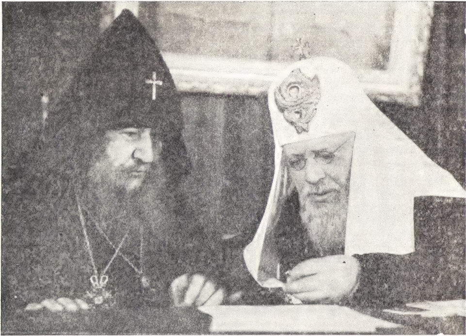
В ПРЕЗИДИУМЕ КОНФЕРЕНЦИИ Святейший Патриарх Московский и всея Руси Алексий и Верховный Патриарх-Католикос всех Армян Георг VI

встретило широкую поддержку и у последователей буддизма. В Монголии, на Цейлоне, в Бирме — везде, где есть буддисты, раздается голос их духовенства, свидетельствующий, что «поддержание мира полностью соответствует целям, которые ставит перед собою буддизм».